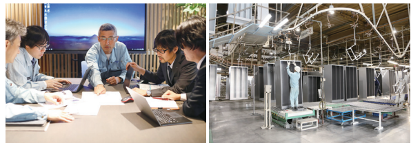
顧客の期待に応える提案力で業界をリードする（左）箱物生産の高効率化を実現する大量生産ライン（右）

同社の売上は100%国内向けで、売上高のシェアは関西3：関東7の割合となっている。現有の工場設備はロッカーを1日約700台生産する能力があり、国内最大級の生産体制を誇る。関東の拠点である茨城工場は、茨城県大阪事務所から工場誘致を受け、1991年稼働に至った。2011年3月に東日本大震災が発生した時はちょうど繁忙期で、工場の天井や壁は剥がれ落ち、盛り土をしたエリアは液状化現象が発生した。工場内のラインも被害を受けたが、三重工場の社員から励ましの手紙が多数寄せられ、“すぐに復旧しよう”と社内が一致団結し、半年ほどで復旧にこぎ着けたと言う。